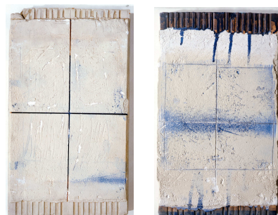
Bris Signe V bis, 1979

Ramasser, broser, frotter, griffer, scier, inciser, plier... sont autant d'actions qui témoignent de la matérialité des choses. Tout élément possède un potentiel expressif qu'il convient à l'artiste de révéler.