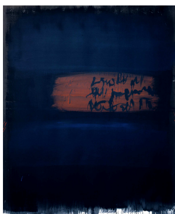
Suite obscure VIII, 2 décembre 1964

De la nature au signe , Jean Degottex découvre les fondements de son travail de peintre : méditation et impulsion. Energie contenue, violence maîtrisée, élaboration lente et minutieuse caractérisent ses œuvres grand format de la fin des années 50.