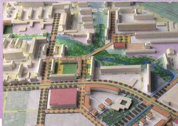
1 ère maquette du projet de restructuration.

Réalisé par les Archives municipales et le service Communication de la Ville de Bourg-en-Bresse en 2006. Remerciements au groupe mémoire de la Reyssouze. Impression : Comipress.