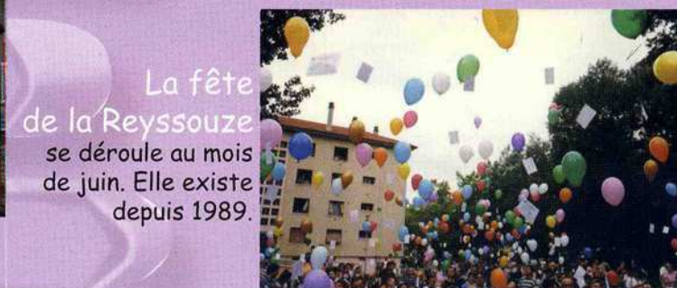
La fête de la Reyssouze se déroule au mois de juin. Elle existe depuis 1989.

Place Alexandre Dumas, inauguré en 1967. Il est mitoyen avec le foyer des jeunes travailleurs et le club des aînés.